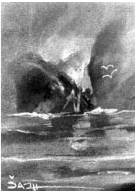
Željko Šajh: Iz ciklusa Biljeg

PUČKO OTVORENO UČILIŠTE VELIKA GORICA Zagrebačka 37 izložba slika Željka Šajha »Biljeg«.