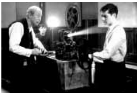
Michael Caine i Tobey Maguire

U filmu nastupaju hip-hop i R & B glazbenici Erykah Badu i Heavy D u malim, ali bitnim ulogama, te Kate Nelligan i Kieran Culkin. Glume: Tobey Maguire, Charlize Theron, Delroy Lindo, Paul Rudd, Michael Caine