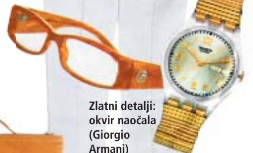
Zlatni detalji: okvir naočala (Giorgio Armani) i vintage sat (Swatch)