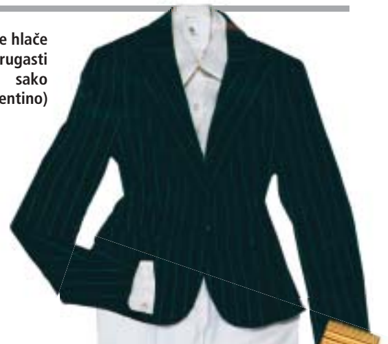
Bijele hlače i prugasti sako (Valentino)

■ Nakon dvadesetak godina ponovno ćemo dopustiti da naša odijela govore koliko smo jake, sposobne i - zaljubljene