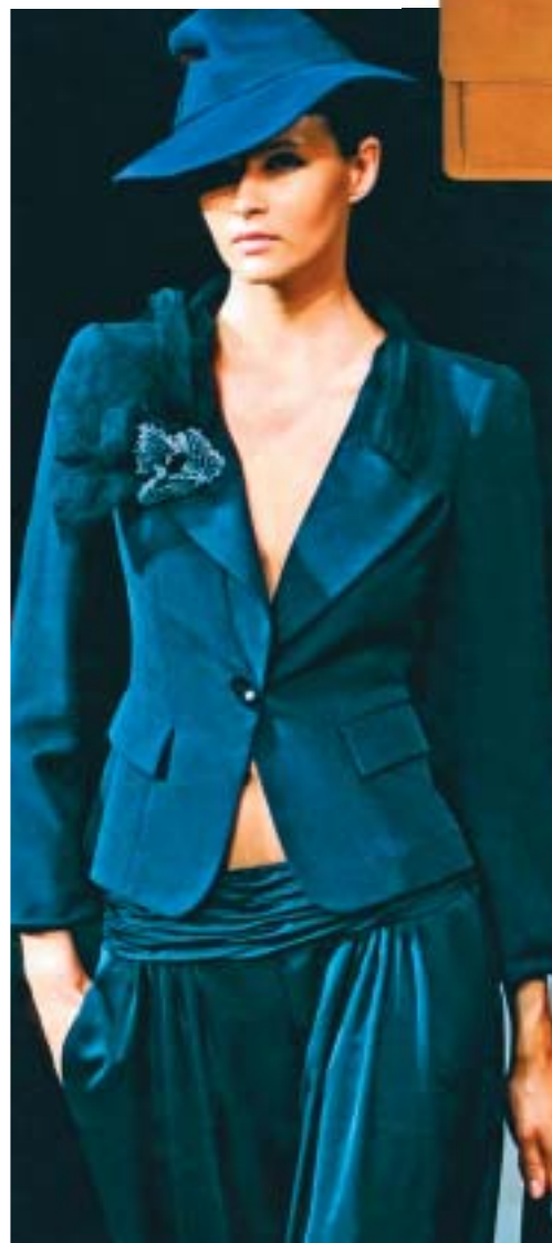
Strogo krojen sako i hlače mekane kao dimije (Giorgio Armani)

■ Nakon dvadesetak godina ponovno ćemo dopustiti da naša odijela govore koliko smo jake, sposobne i - zaljubljene