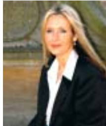
J. K. Rowling