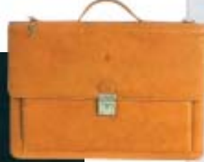
»Muška« aktovka za nježnu žensku ruku