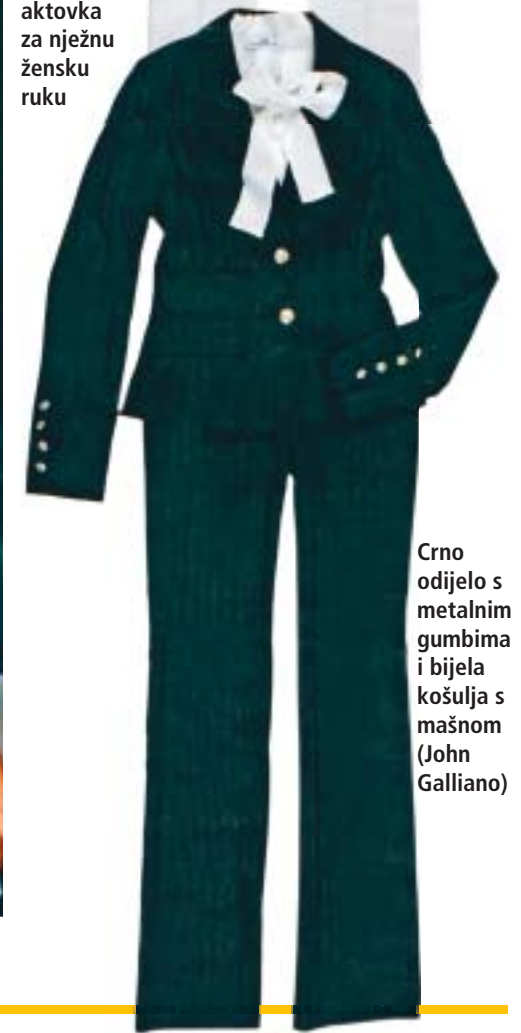
Crno odijelo s metalnim gumbima i bijela košulja s mašnom (John Galliano)