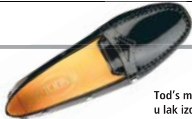
Tod's mokasinke u lak izdanju