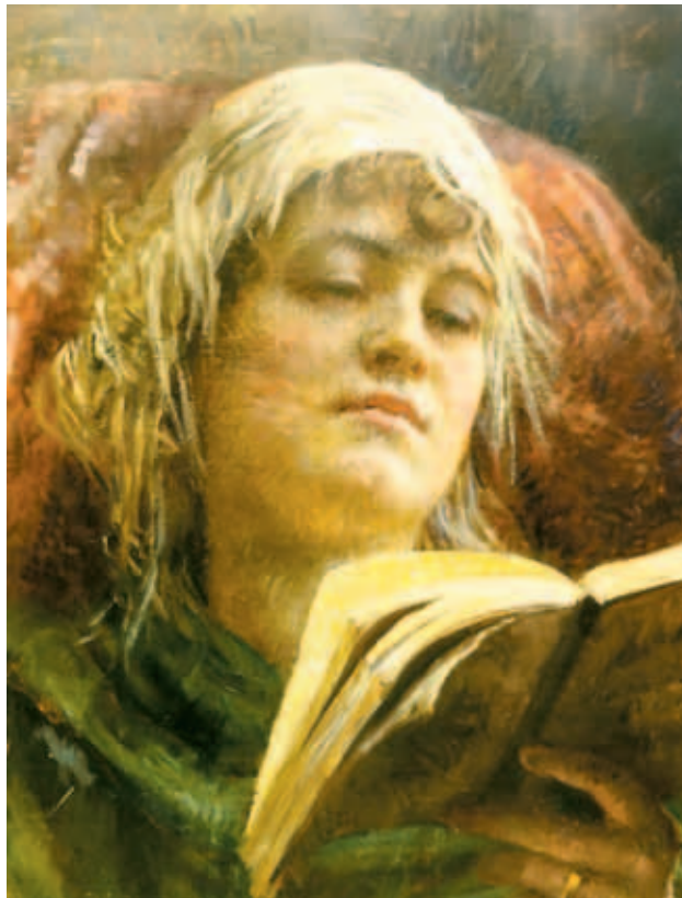
Uatoč visokoj početnoj cijeni od 250.000 kuna, kupci pokazuju interes za »Čitačicu« Vlahe Bukovca

Drugom ovogodišnjom aukcijom Galerija Grubić udara tempo u kojemu više nema uzamaka. »To je minimum s kojim moramo ići da bismo održali kvalitetu auk-