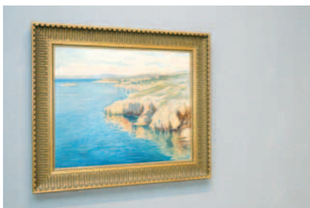
Crnčićovo ulje na platnu na predaukcijskoj izložbi u MUO-u: »Novi Vinodolski«, 75x90 cm

PRIZNANJA Predane ULUPUH-ove nagrada za 2008. godinu