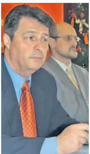
S konferencije za tisak u osječkome HNK

Po riječima maestra Mladena Tutavca, »Povratak« je jednočina opera nastala prema naturalističkoj drami hrvatskog autora Srdana Tucića i »djelo koje zauzi-