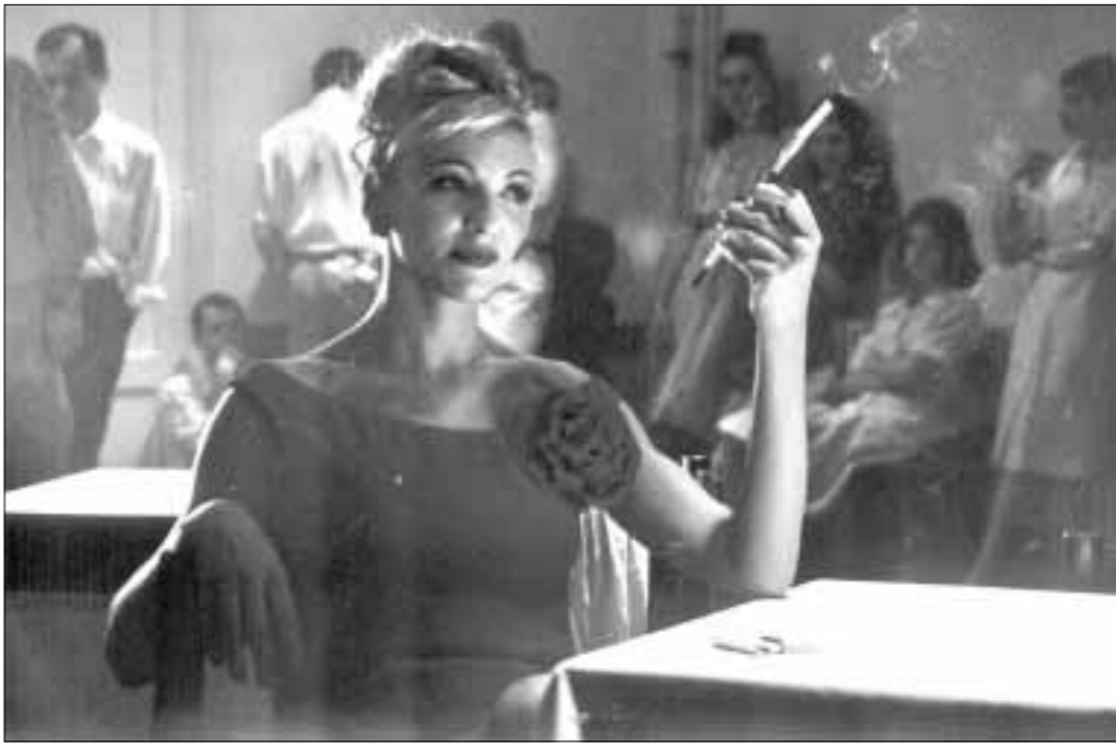
U trci za Oscara: »Kraljica noći« Branka Schmidta

Oscari 2001. spremni su za podjelu, ali doći do njih mukotrpni je put, prvo slijede projekcije, pa borbe za nominacije, pa utrka među pet izabраниh. U takvoj konkurenciji, nismo sigurni da je naša ovogodišnja produkcija, pa ni izabrani predstavnik, dovoljno jaka i spremna za bitku. Posebno što nam je dobro poznat ukus članova odbora Američke filmske akademije koji svake godine odlučuju o izboru i nominaciji filmova u konkurenciji za Oscara za film na ne-engleskom jeziku.