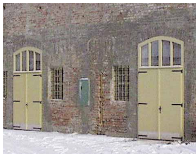
Ovdje će se urediti dom HDLU-a: Prvi bastion u Tvrdri