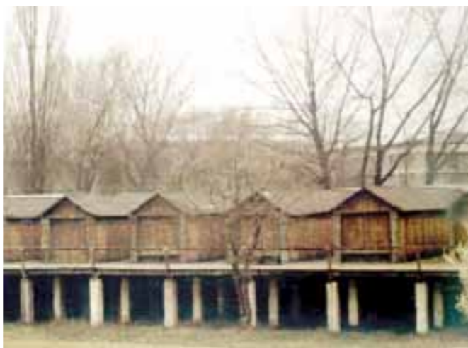
Zauvijek nestalo: Zagrebačko kupalište na Savi