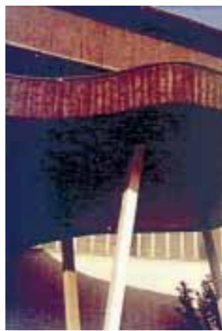
Europskoga značenja: Tehnički muzej (detalj)