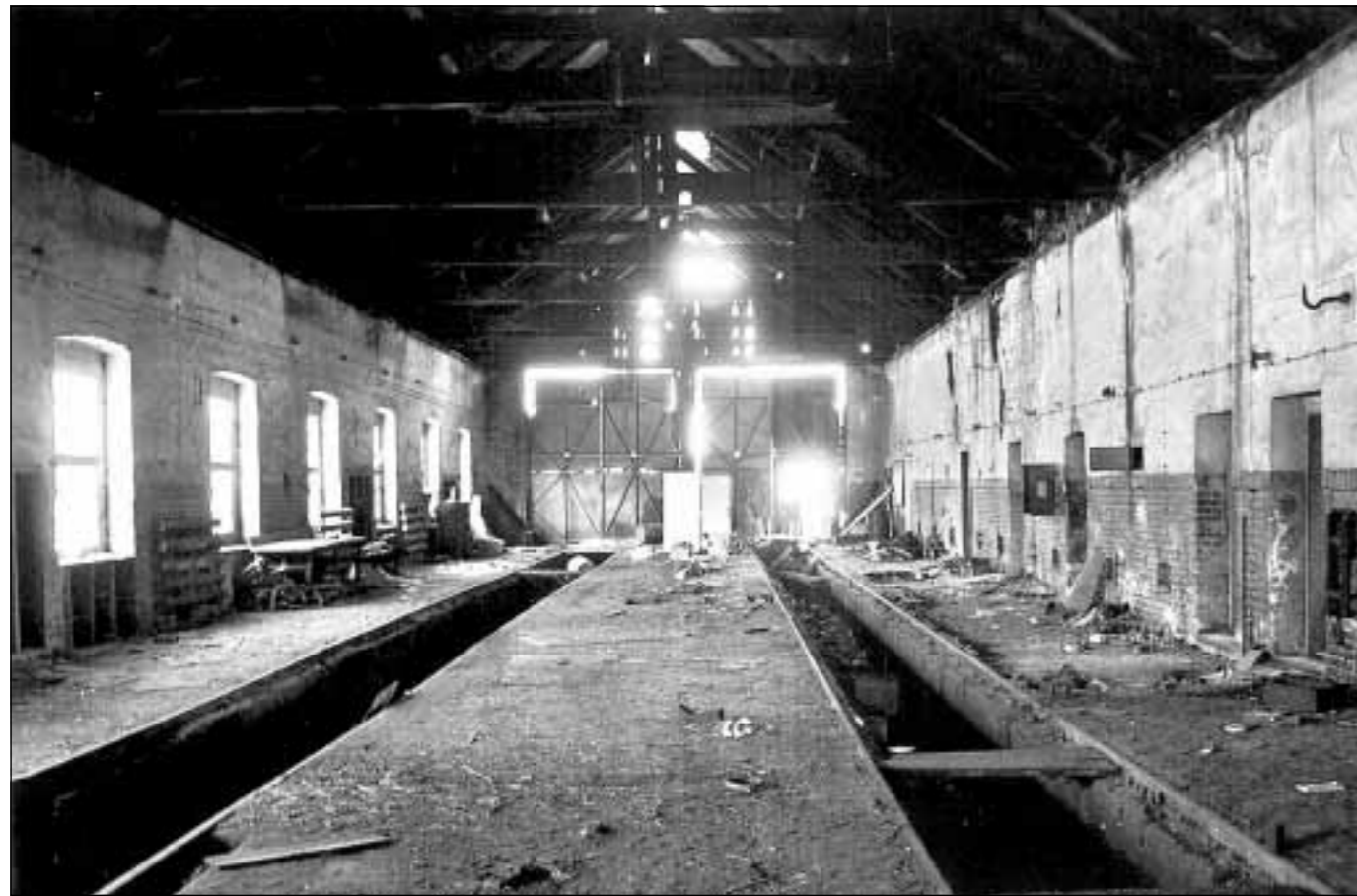
Izazov suvremenosti: Napušteni prostor nekadašnje ložionice Željezničkoga kolodvora u Varaždinu

PROJEKTI – Nastup mladih umjetnika na multimedijalnoj izložbi u Varaždinu