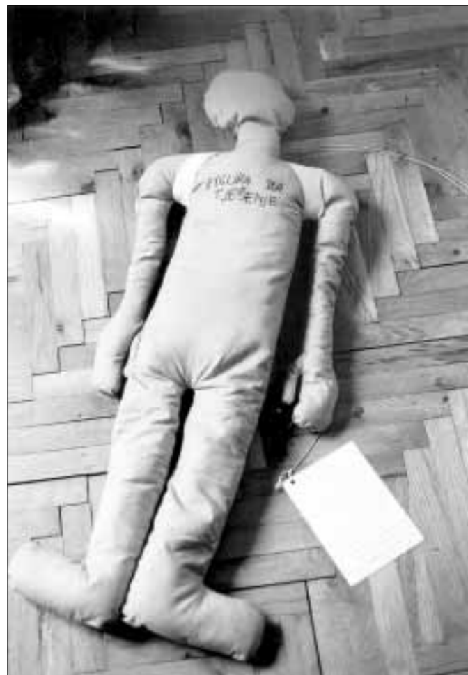
Griliti po potrebi: »Lutka za tješjenje« Ane Horvat

IZLOŽBA – Predstavljanje hrvatsko-slovenske mlade likovne scene