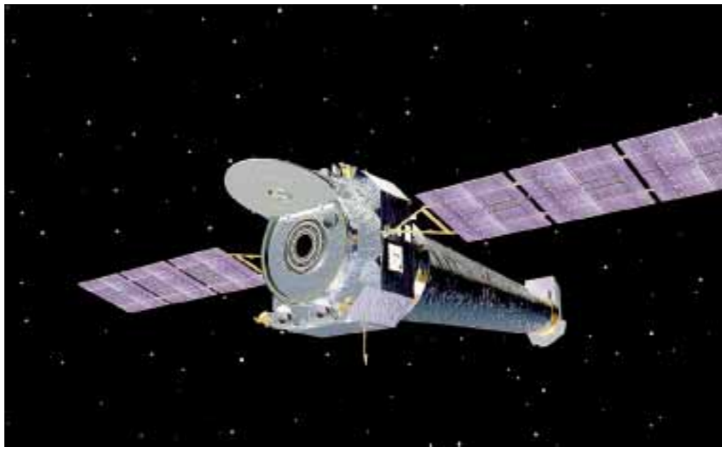
Svemirski teleskop Chandra fokusira x-zračenje mnogo bolje nego što je to mogao i jedan teleskop prije njega.

To rano doba oblikovanja planeta može se istraživati na dva načina: promatranjem drugih zvijezda, što je slično otvaranju Knjige postanka, ili proučavanjem nekih starih materijala skrivenih u stijenama koje lutaju svemirom i koje nisu taknute otkad su nastale. U