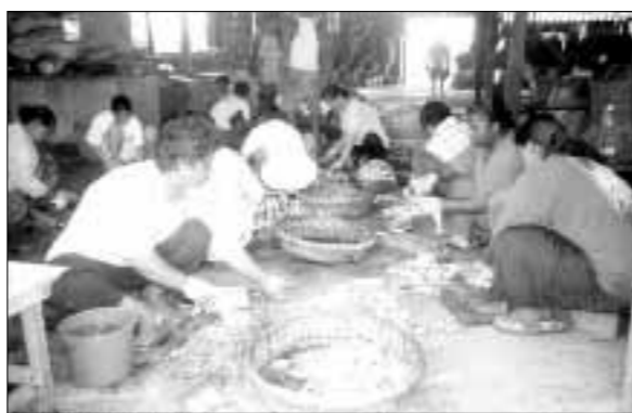
Malezija je devedesetih godina dvadesetog stoljeća razvila jako dobru sliku o sebi kao o multietničkoj muslimanskoj državi, ali...

jedi kao robna marka: U današnjem globaliziranom svijetu i moćna globalna kompanija i moćna država moraju imati »snažnu« robnu marku koja će privlačiti i zadržavati potrošače i investitore.