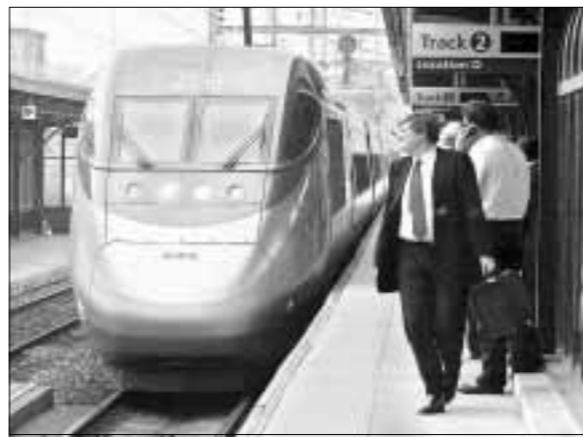
Dovoljno je vidjeti stanje željezničkog sustava u Britaniji pa ćete vidjeti kako će vas donijeti rješavanje problema na američki način. U ovom slučaju, riječ je o privatizaciji nekada dobro vođenih javnih službi