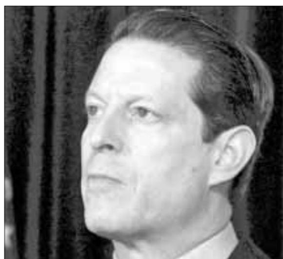
»Izabrani predsjednik Sjedinjenih Država je Al Gore. On je dobio 539.898 glasova više nego George W. Bush. Ali ne sjedi on večeras u Ovalnom uredu...«

»naš način života« – kad to znači samo životne navike sijedih staraca ukopanih u svoje stožere koje su zauzeli oko rijeke Potomac?