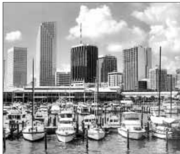
U Miami Dadeu, najvećem okrugu na Floridi, 66 posto uklonjenih birača bili su crnci. U okrugu Tampa crno je bilo 54 posto onih kojima je uskraćeno pravo glasa

dakle i na izborima. I to je učinjeno. Fox je službeno proglasio Busha pobjednikom.