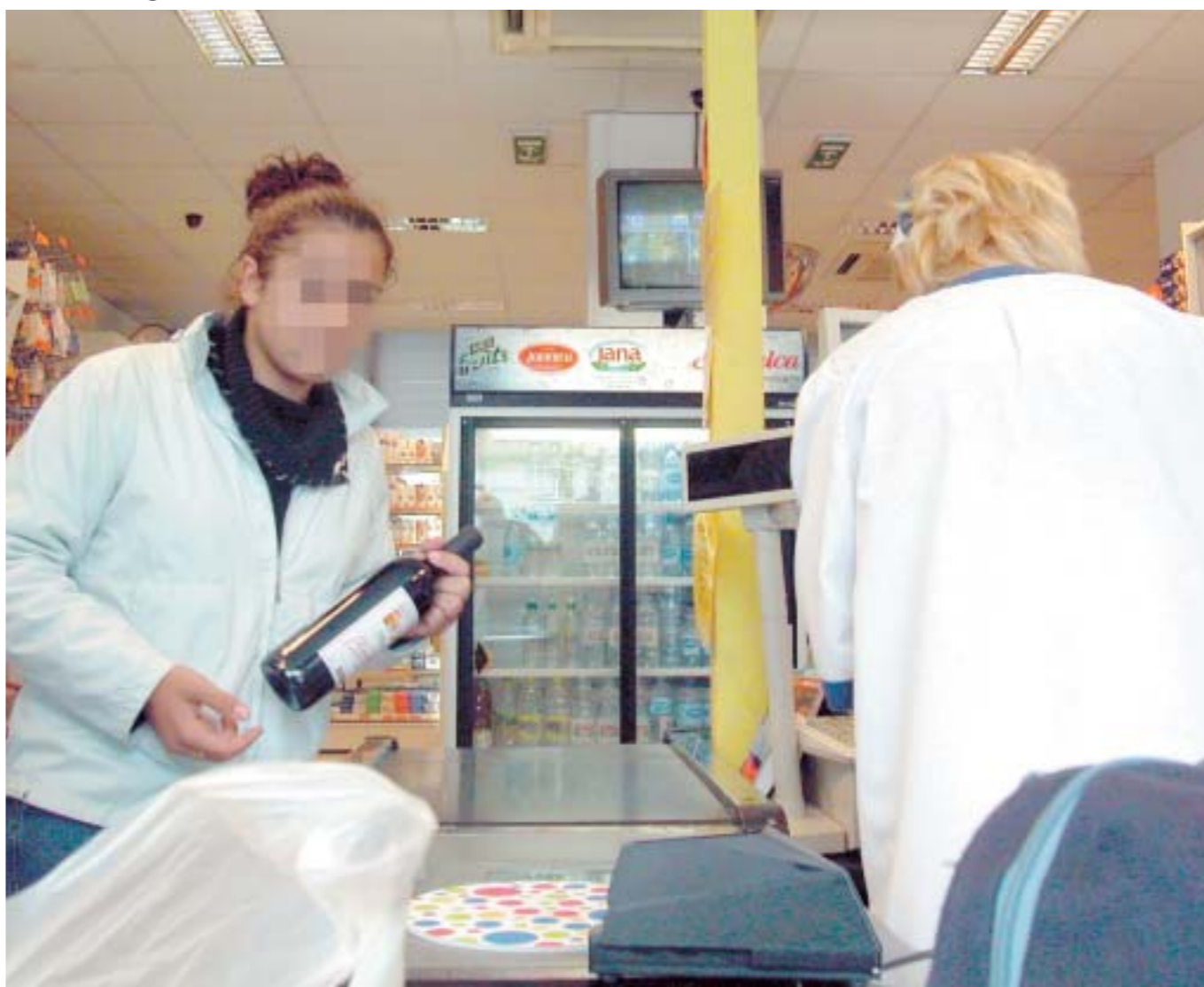
Djevojka kupuje vino u samoposluživanju