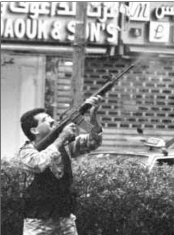
Izraelski su vojnici u Libanonu zarobili mnoge seljane od kojih su neke su odveli u Izrael, razorili su, oštetili ili opljačkali mnoge kuće u selu. Za to je vrijeme Shimon Peres izjavio kako izraelska potraga za otetim vojnicima »izražava naše poštovanje vrijednosti i dostojanstva ljudskog života«

Dana 7. travnja izraelski su zrakoplovi bombardirali iste te logore te susjedno selo, ubivši dvoje i ranivši dvadeset osoba. Tvrđilo se kako su teroristi odatle kretali u napade, kaneći ubijati