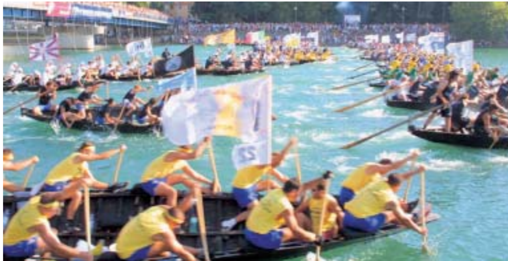
Na startu u Metkoviću bilo je više od 300 lađara