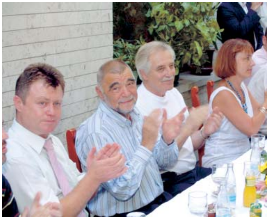
Predsjednik Mesić bio je odlično raspoložen

Prema procjenama ovogodišnji veliki neretvanski spektakl s obje obale Neretve vidjelo je više od 50 tisuća Neretvana i njihovih gostiju.