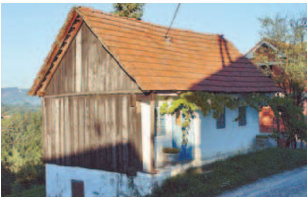
Stara kuća u Gornjem Ježovcu koja će do ljeta dobiti novi krov - od škopa

Cijena je jednog škopa-za-vežljaja ražene slame promjera oko 30 cm - 60 kuna i vrlo ga je teško nabaviti. U općini je u tijeku i izrada slamnatog krova - škopa. Mladi bednjanski obrtnik