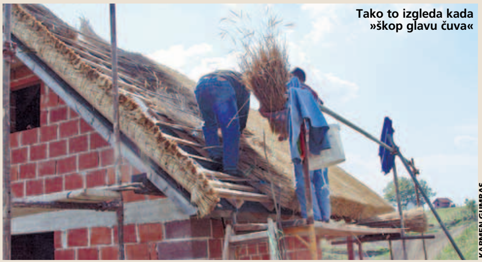
Tako to izgleda kada »škop glavu čuva«