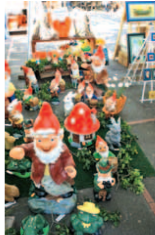
Neki od zanimljivijih detalja za ukrašavanje vrtova

Ovogodišnji je sajam, kazala je organizatorica Mirjana Brickweg iz tvrtke Adriexpo, okupio 27 izlagača iz Hrvatske, što je rezultat šestomesečnih priprema. Otvorajući Sajam, pročelnik gradskog Odjela za poduzetništvo Andrija Vitezić kazao je da posjetitelji mogu povoljno nabaviti nove sadnice te dobiti podatke o cvijeću kroz predavanja stručnjaka, savjete ponuđača i radionice. Uz izložbu i prodaju cvijeća, organizirane su i tri praktične radionice, na kojima će se moći više čuti o sadnji i kombiniranju cvijeća