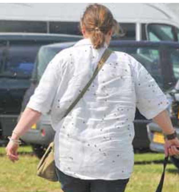
Ljeto donosi dosadne, a ponekad i opasne najezde insekata

Liječnici takva stanja koja mogu brzo završiti smrću nazivaju anafilaktički šok za koji ne pomaže ni masiranje srca niti umjetno disanje, nego samo injekcija adrenalina koju bi alergični na otrove kukaca, odnosno tvari koje pri ubodu ispuštaju u tijelo, trebali nositi u se. Problem je kada pojedinac nije svjestan da je alergičan i tu nema pomoći do mudrog izbjegavanja susreta s insektima, kao i drugim nevoljama koje mogu snaći čovjeka u prirodi, ali i u naseljenim mjestima.