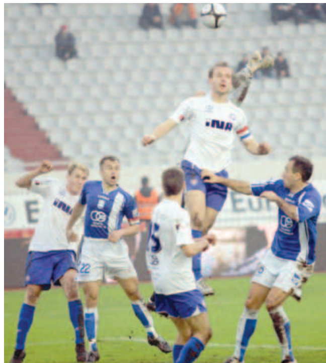
»Bijele« je na Poljudu iznenadio bijeli pokrivač

»Ako igrači naprave ono što dogovorimo, sumnjam da će biti neodlučeno. Doduše, bod nas još ostavlja u igri za naslov«, kaže Miše